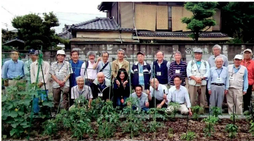
豊中あぐり岡町菜園（豊中市岡町南1丁目 11-25）阪急電鉄 岡町駅から徒歩5分