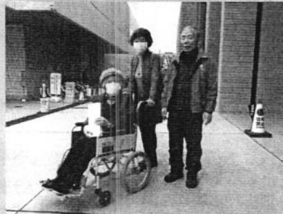
車いす・アイマスク体験 (みちしるべ)