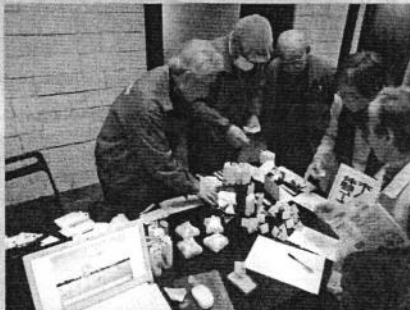
ホームページ記事入力体験 ・紙工作 (アクセス)