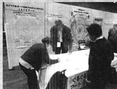
ぐるぐるアート (ぐるぐるアート豊中世話人会)