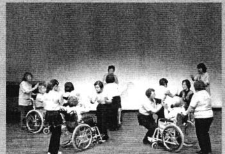
車いすでダンスを踊る (車いすダンスコスモスの会)