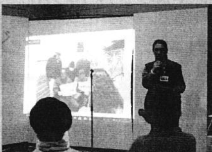
活動発表 (団塊塾とよなか)