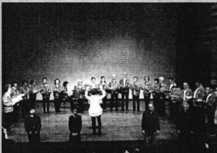
オープニング 合唱「しあわせ運べるように」 (ボランティア有志合唱団)