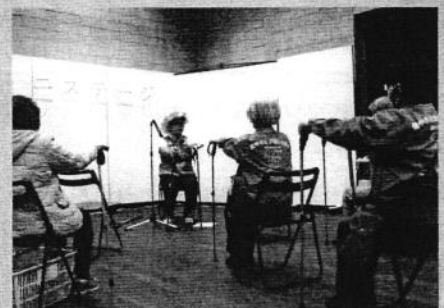
ノルディックウォーク体験 (TERVE 北大阪)