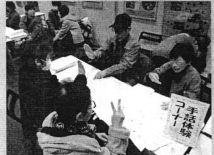
手話体験 (手話サークル虹、あさなぎ、 ジャンケンポン、トマト)