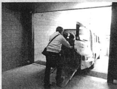
福祉車両試乗体験 (豊中アッシー)