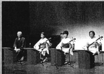
三味線演奏・日本民謡 (秀珈会)