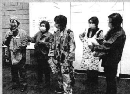
手作り介護用品紹介 (小さな手)