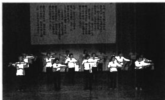
第27回豊中ボランティアフェスティバルのステージ発表で、歌体操を披露!