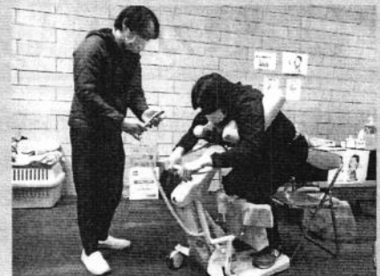
ふくしの仕事体験コーナー (豊中市社会福祉施設連絡会)